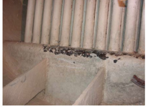
Buhar kazanının alev tarafındaki tortu