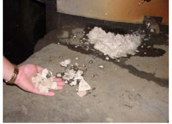
Buhar kazanı dibindeki tortu