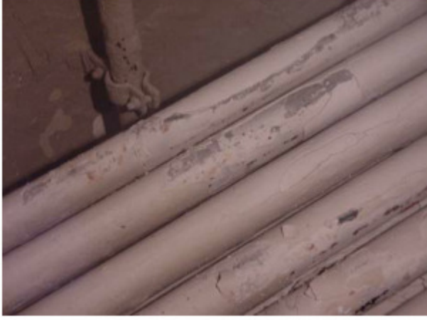
Alev borularındaki tortu